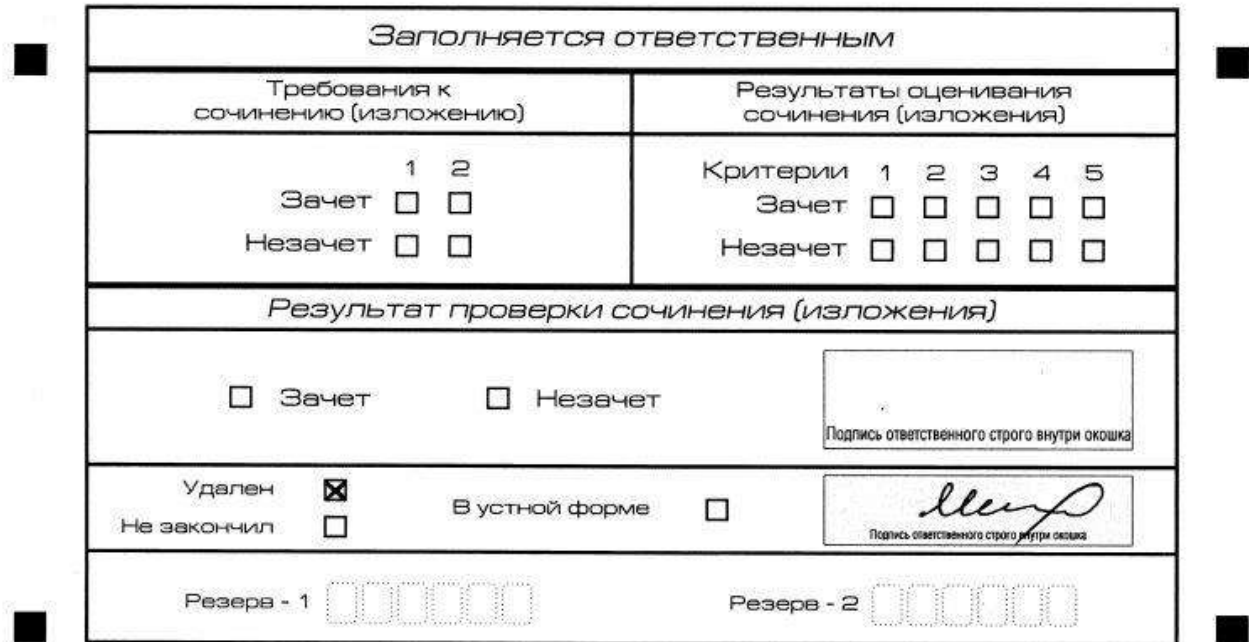
Рис. 12. Заполнение полей нижней части бланка регистрации (удаление с экзамена)

отметку в форму ИС-05 «Ведомость проведения итогового сочинения (изложения) в учебном кабинете ОО (месте проведения)» (участник итогового сочинения (изложения) должен поставить свою подпись в указанной форме). В бланке регистрации указанного участника итогового сочинения (изложения) необходимо внести отметку «X» в поле «Удален». Внесение отметки в поле «Удален» подтверждается подписью члена комиссии по проведению итогового сочинения (изложения) (рис. 12).