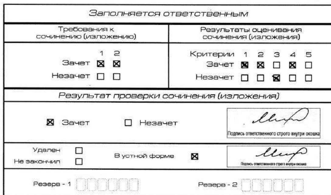
Рис. 10. Область для оценки работы сочинения (изложения) в устной форме

После окончания заполнения бланка регистрации ответственное лицо ставит свою подпись в специально отведенном для этого поле.