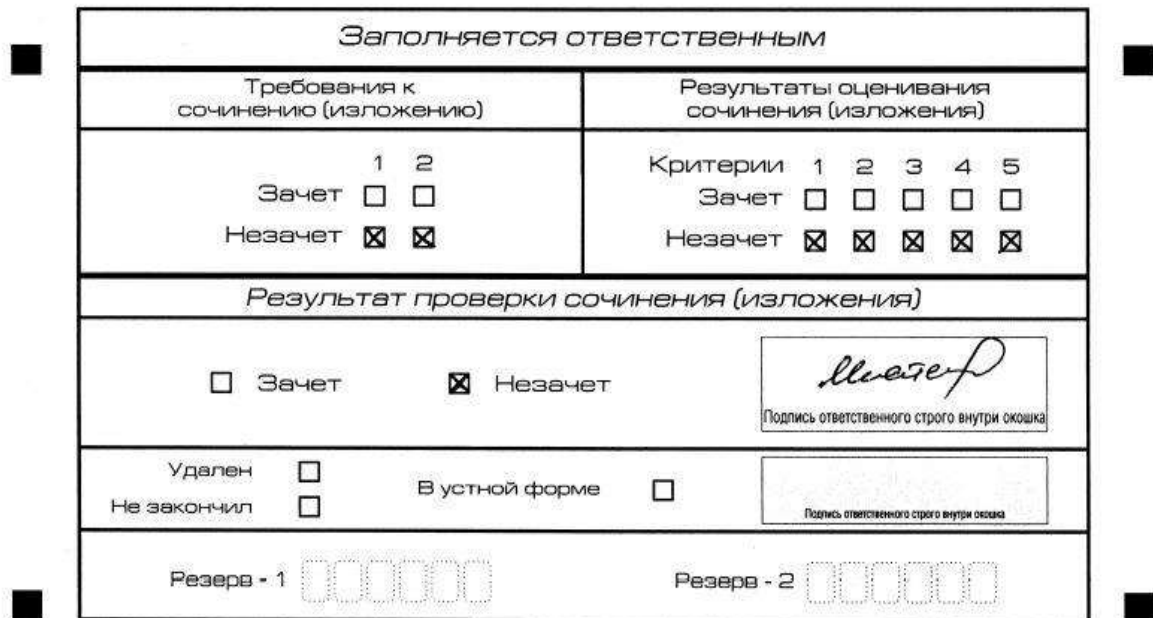
Рис. 7. Область для оценки работы

Выставляется «незачет» за невыполнение требования №2. В клетки по всем критериям оценивания выставляется «незачет». В поле «Результат проверки сочинения (изложения)» ставится «незачет» (рис. 8).