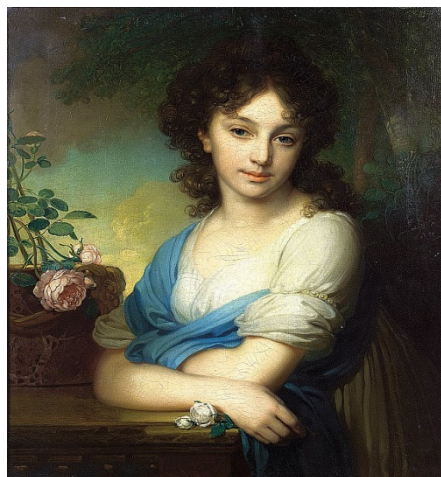
б) В. Боровиковский «Е.А.Нарышкина»