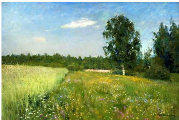
в) И.Левитан «Лето»